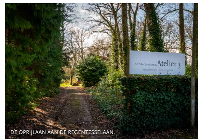
DE OPRIJLAAN AAN DE REGENTESSELAAN.

het houten Noorse huis op de Nieuwe 's Gravelandseweg. Dit werd enkele jaren geleden door de Gouden Makelaar uit Laren zowel als bestaande woning aangeboden, maar ook als bouwgrond, na sloop van het bestaande historisch belangrijke huis. Ik heb daar toen over geschreven in Spiegelschrift en vervolgens ons standpunt persoonlijk toegelicht voor de commissie, die de dubbele aankondiging op Funda kennelijk niet kende. Daarna heeft het houten huis uit het begin van de 20ste eeuw een status gekregen van Gemeentelijk Monument. En moet je kijken hoe het er nu bijstaat: helemaal opgeknapt, als nieuw. Met liefde en volgens de regels in oude luister hersteld. Ik dacht indertijd al: de commissie had ook zelf het handigheidje van de Gouden Makelaar kunnen doorzien.