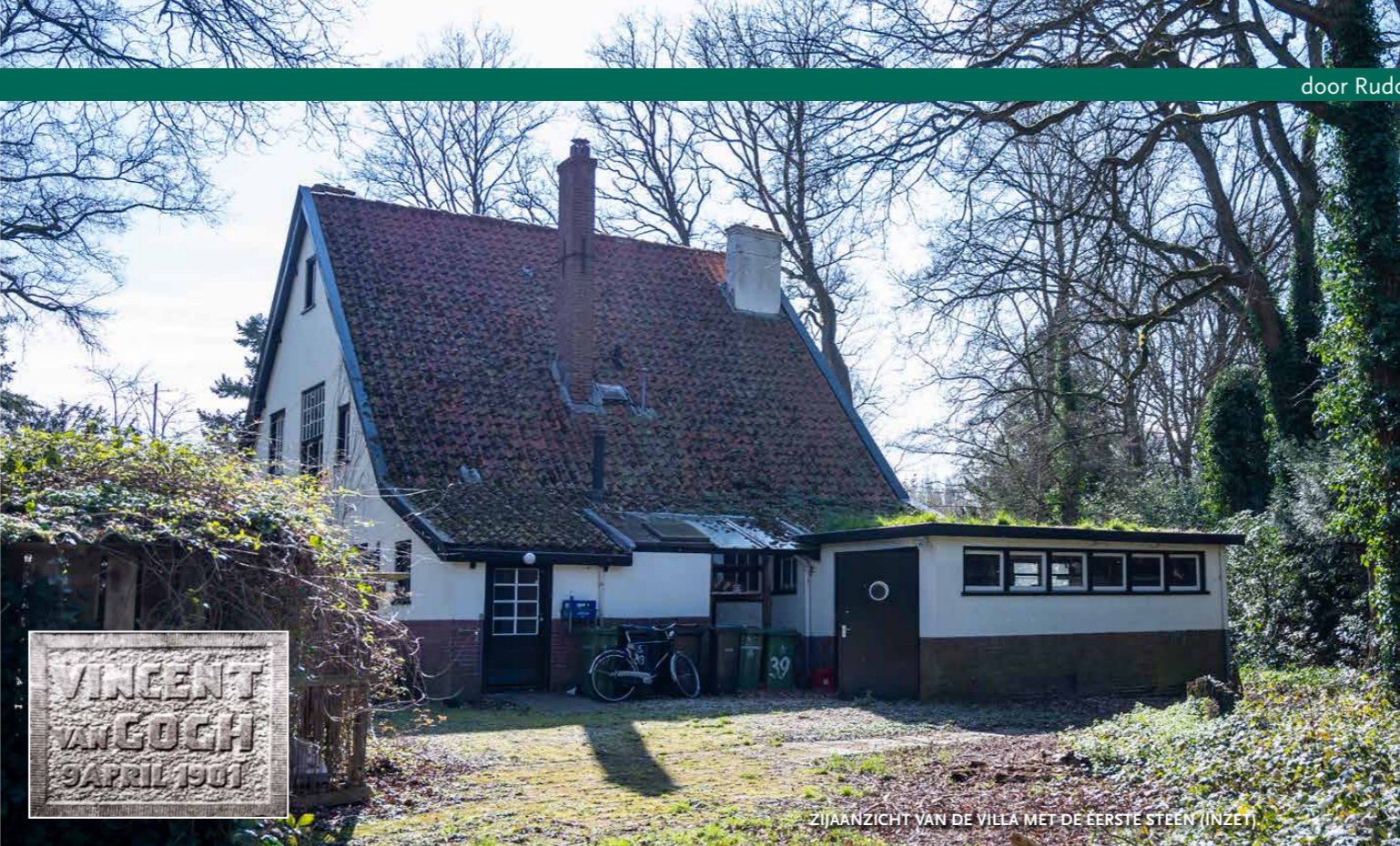
ZIJAANZICHT VAN DE VILLA MET DE EERSTE STEEN (INZET)